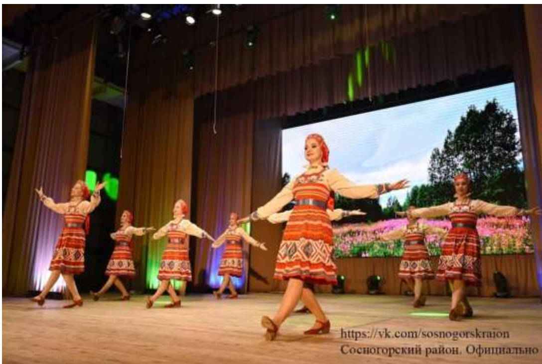
Праздничный концерт в рамках 100-летнего Юбилея Республики Коми (22 августа). Гостем мероприятия стала российская поп-группа «Турбомода» (с 1999 года).