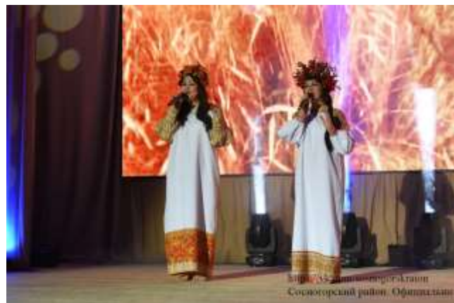
Праздничный концерт в рамках Дня Защитника Отечества (23 февраля) «Во Славу Отечества!»