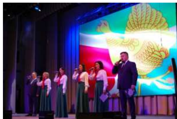
Выездной концерт в столицу Республики Коми г. Сыктывкар на Дни сосногорского района и в рамках 100-летнего Юбилея Республики Коми «Сосногорск - культурное сердце Республики».