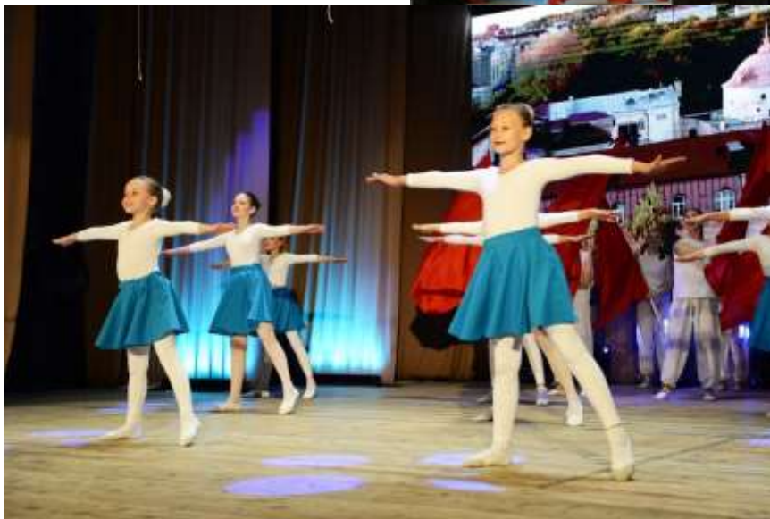
Праздничный концерт ко Дню России (12 июня).